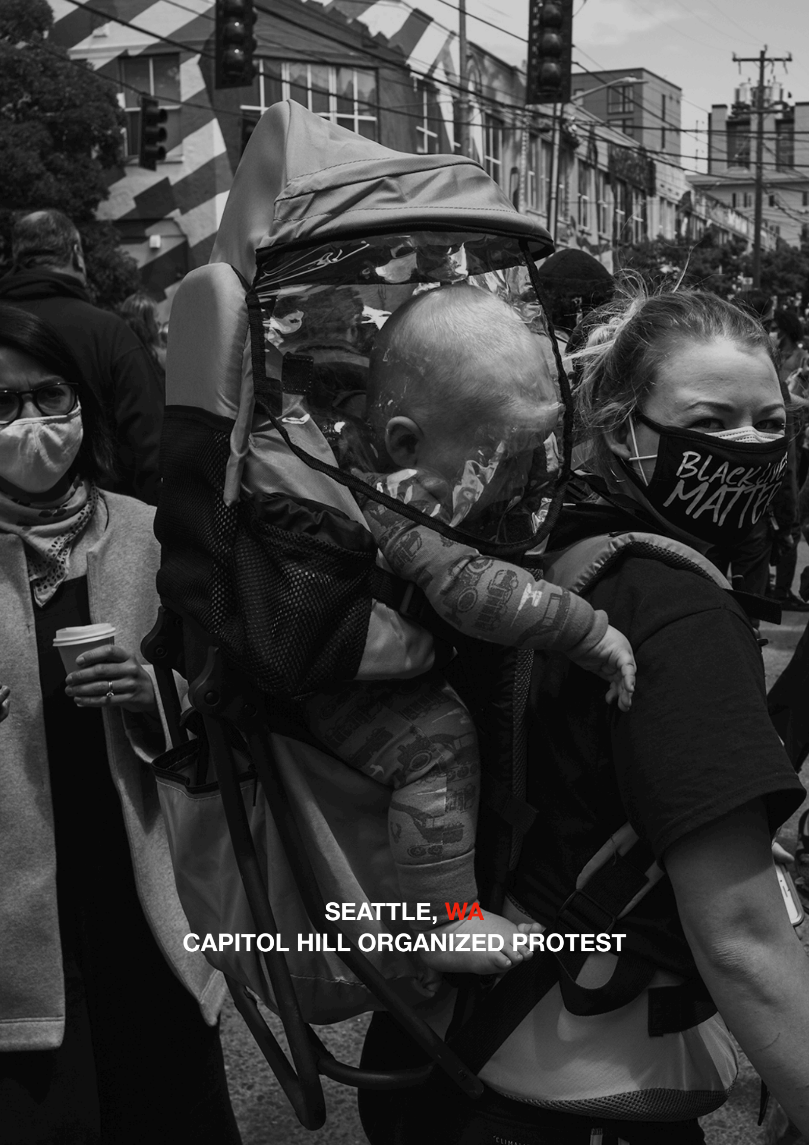
SEATTLE, WA CAPITOL HILL ORGANIZED PROTEST